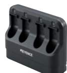
电池用 4 连充电器 BT-WCG14 (附带 AC 适配器)